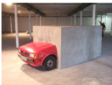
"Pession acoustique : essai numéro 1", 2009

Orange Saint-Mauront, vidéo, 15 min env.