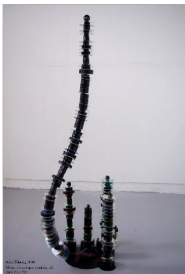
Afro Disco, 2008