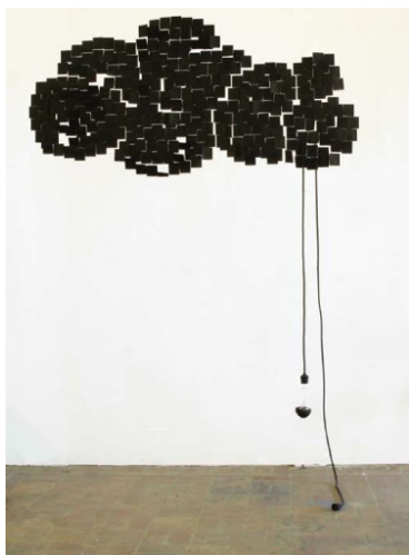
Sans titre, 2009