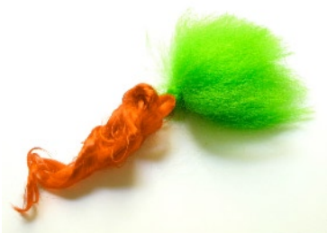
Carotte de pois, 2008