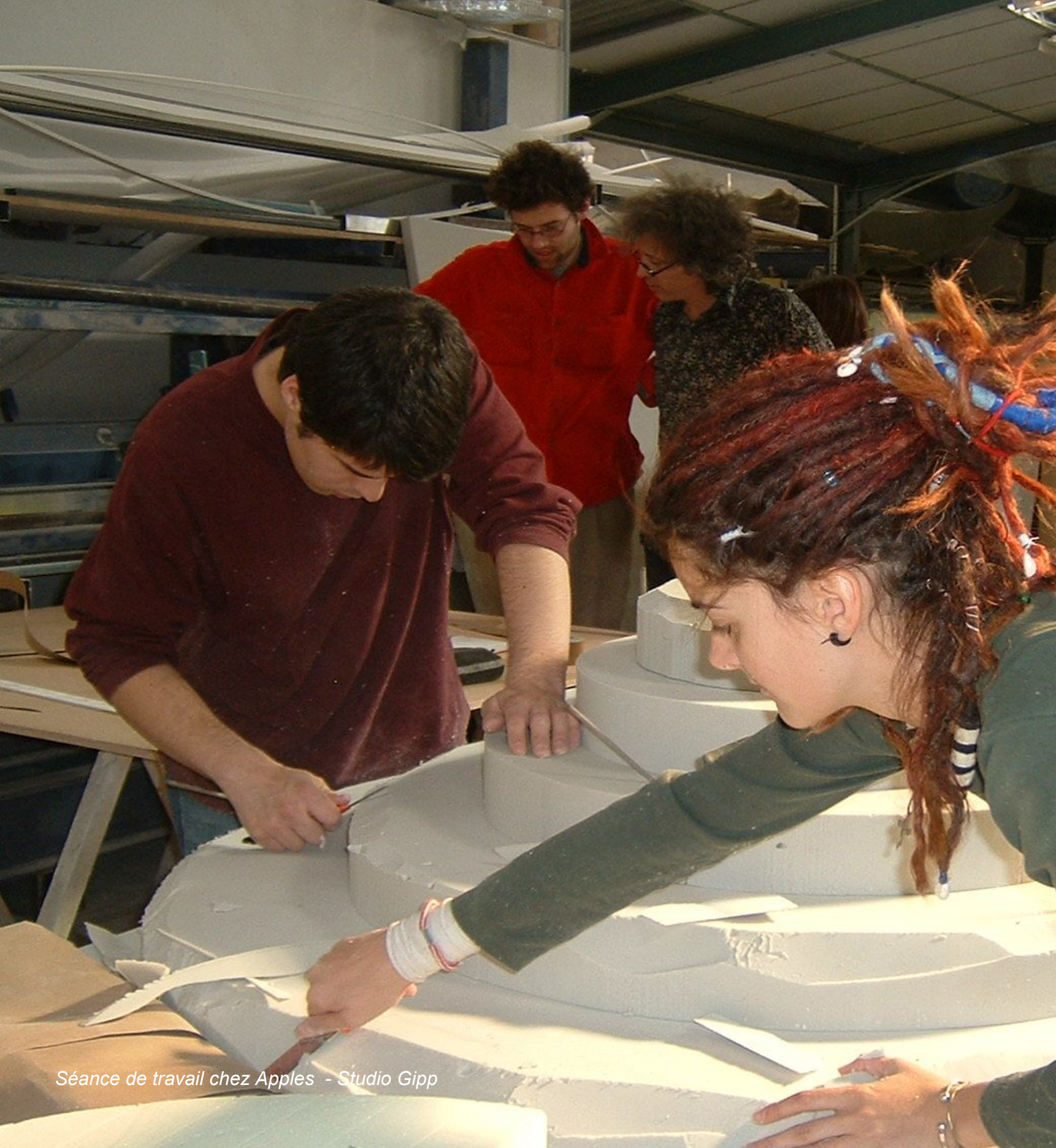
Séance de travail chez Apples - Studio Gipp